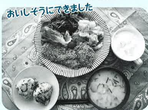
おいしそうにできました