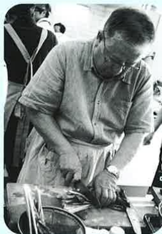
なかなか上手なてさばぎや...