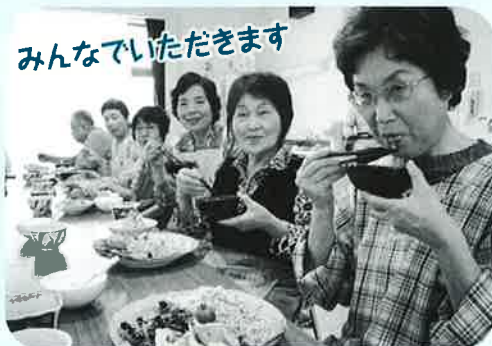
みんなでいただきます